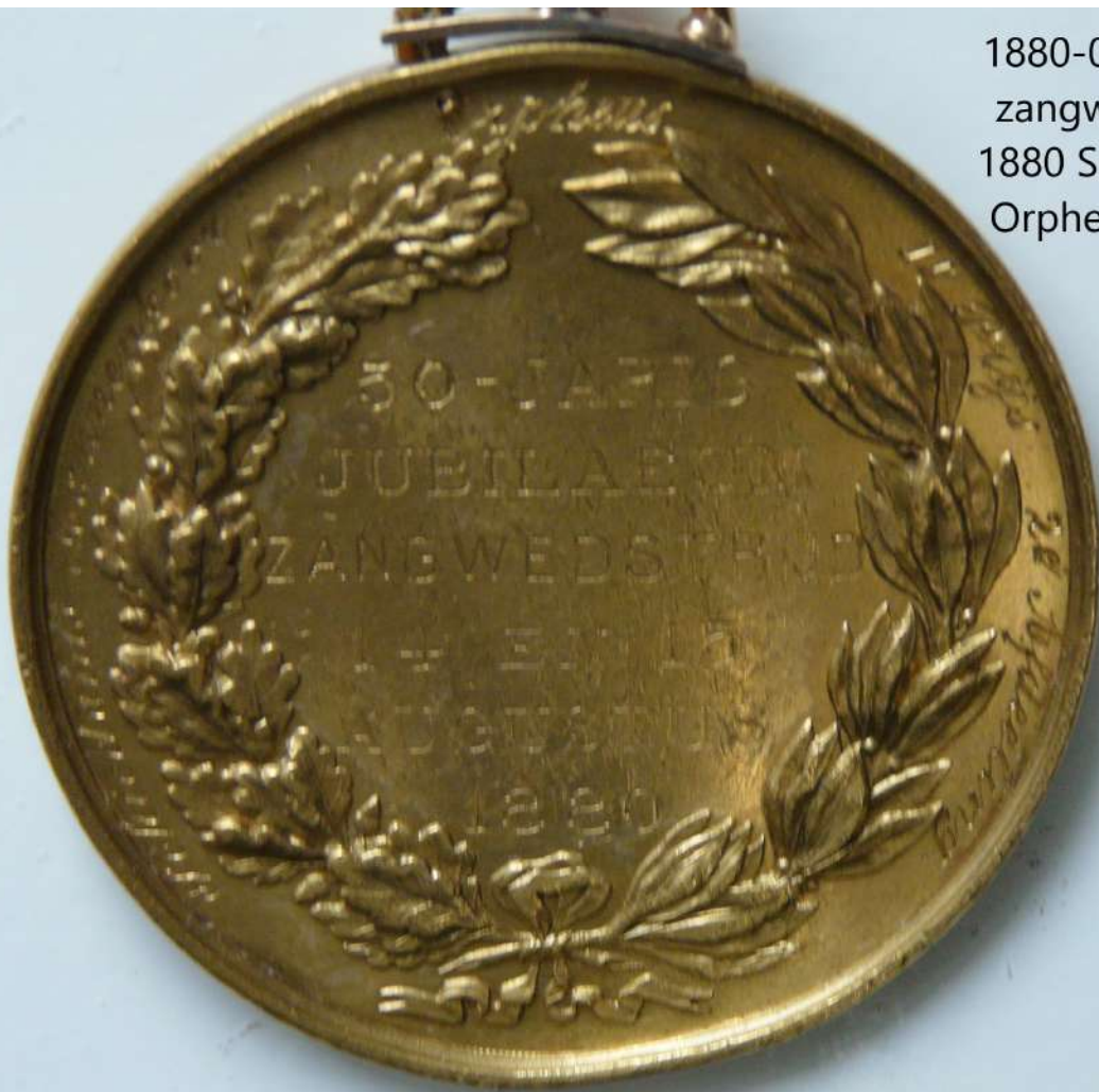
1880-08-14 50 jarig jubileum zangwedstrijd 14 en 15 aug 1880 Schiedams Mannenkoor Orpheus 1e prijs 2e afdeling