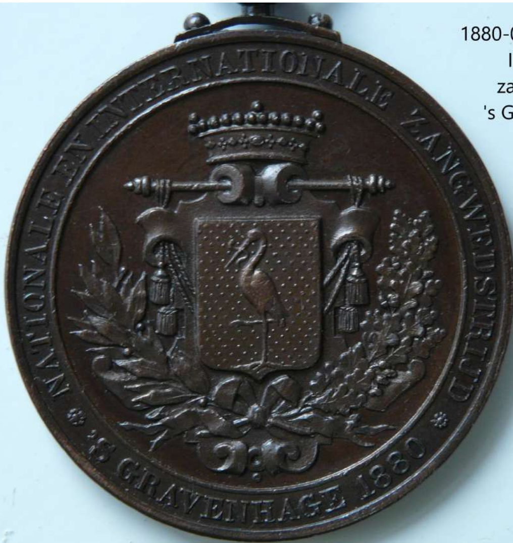
1880-08-14 Nationale en Internationale zangwedstrijden 's Gravenhage 1880