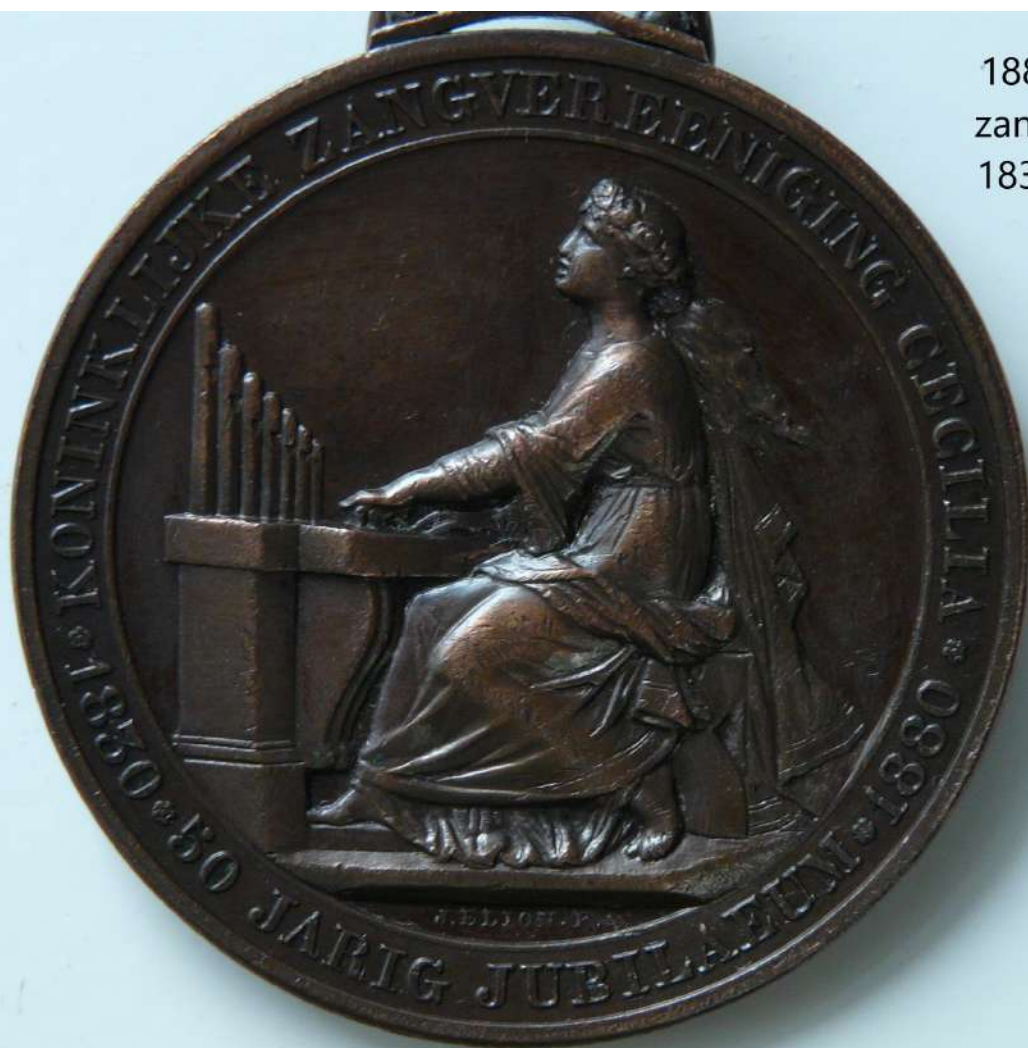
1880-08-14 Koninklijk zangvereniging Cecilia 1830 50 jarig jubileum 1880