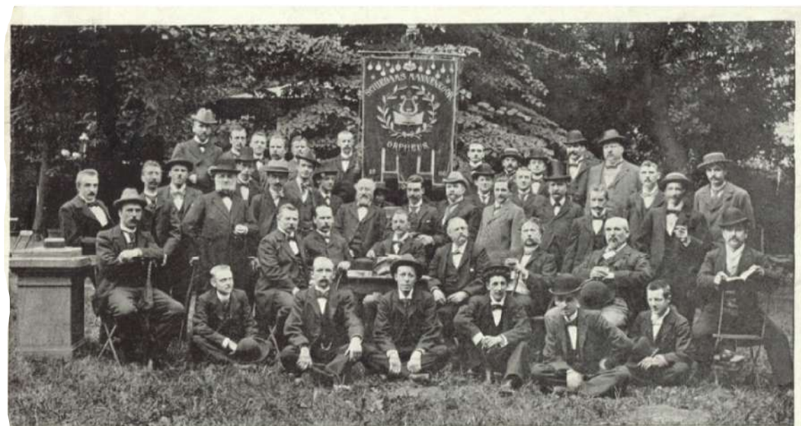
Schiedams Mannenkoor „Orpheus“.