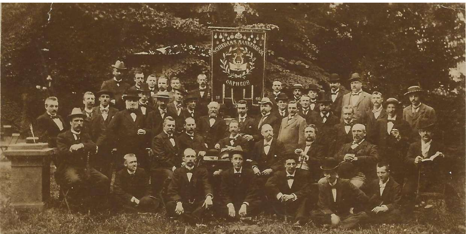
Winners van den 2e Prijs in de eerste afdeling van het Internationaal Zang-Concours, gehouden te Antwerpen op 20 en 21 Augustus 1899, ter gelegenheid van de Van Dijckfeesten aldaar.